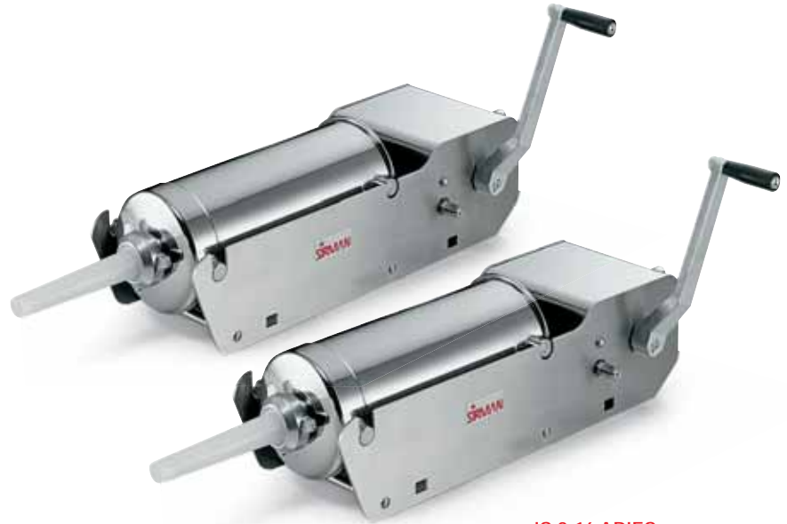
IS 8-16 ARIES