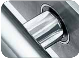
IS 8-16 ARIES