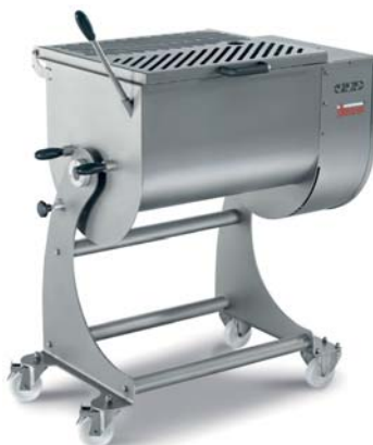
IP 80 XP BA