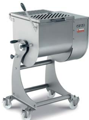
IP 50 XP BA