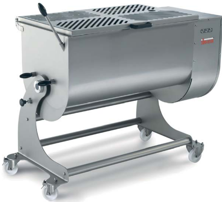
IP 180 XP BA