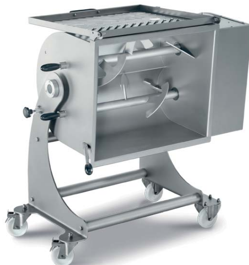
Ribaltamento vasca Tank overturn