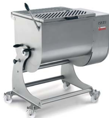
IP 120 XP BA