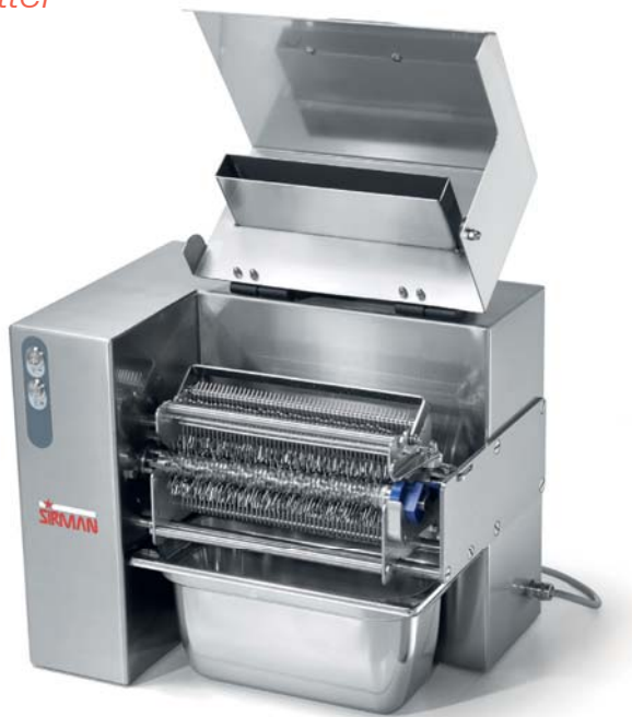
Vaschetta inox opzionale Optional s/steel tray