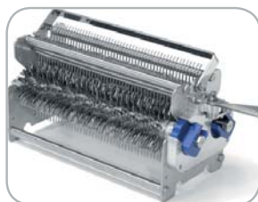
Gruppo lame inteneritrice con 96 lame Tenderizing blade assembly with 96 blades