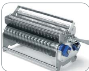
Gruppo lame taglio: da 10 mm con 48 lameda 15 mm con 32 lame Cutting blade assembly: 10 mm with 48 blades 15 mm with 32 blades