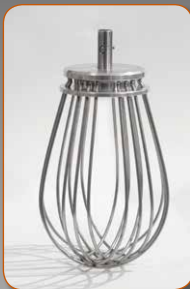
Fruste Whisks Batidoras Венчик