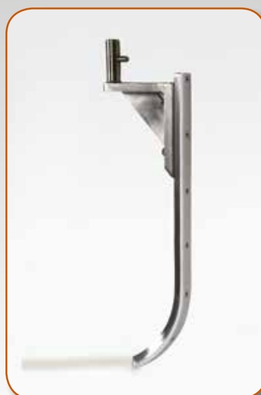
RASCHIATORE SCRAPER RASCADOR Скребок