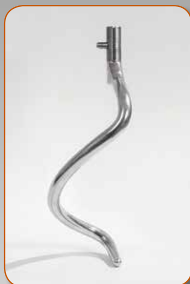
Utensile a spirale Spiral Utensilo espiral Спираль