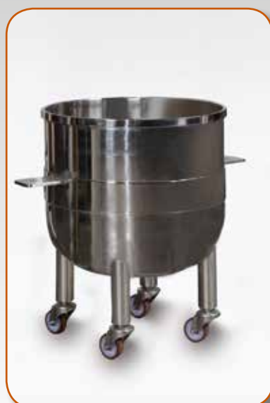
VASCA BOWL PEROL Дежа