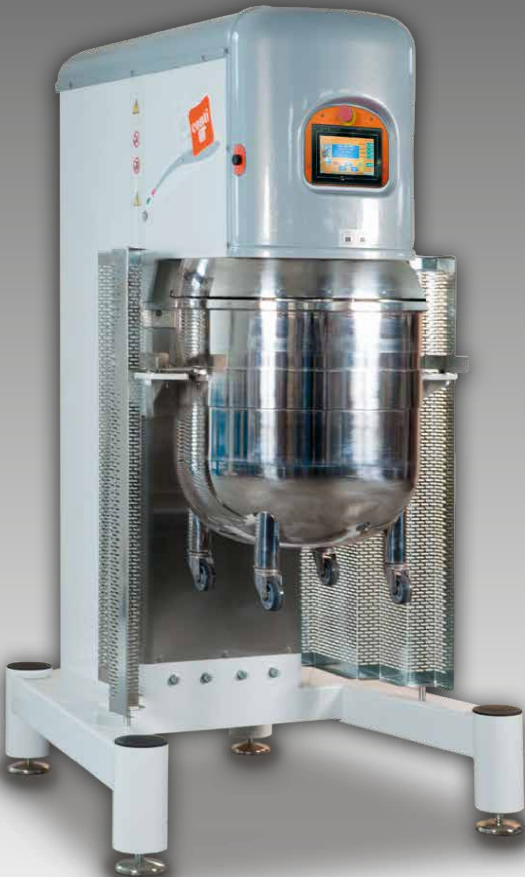
PLANETARIA CON VARIATORE ELETTRONICO LT. 80/100/120/150/200/250/300 PLANETARY MIXER ELECTRONIC SPEED VARIATOR LT. 80/100/120/150/200/250/300 BATIDORAS CON VARIADOR ELECTRONICO DE VELOCIDAD LT. 80/100/120/150/200/250/300 ПЛАНЕТАРНЫЙ МИКСЕР С ЭЛЕКТРОННЫМ ВАРИАТОРОМ СКОРОСТИ LT. 80/100/120/150/200/250/300