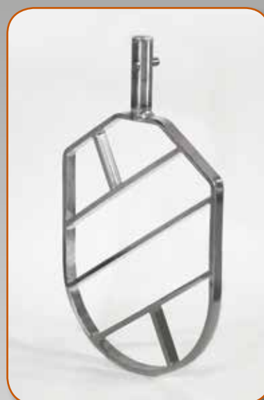
Spatola Spatula Pala Лопатка